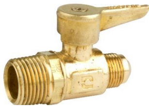
Válvula de Paso Flare a NPT Macho