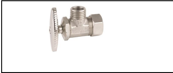
Valvula Angular de compresión