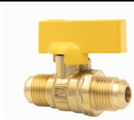
Válvula de Paso Flare a Flare