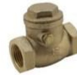
Válvulas de Retención Horizontal