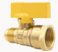
Válvula de Invierno Flare Macho a NPT Hembra