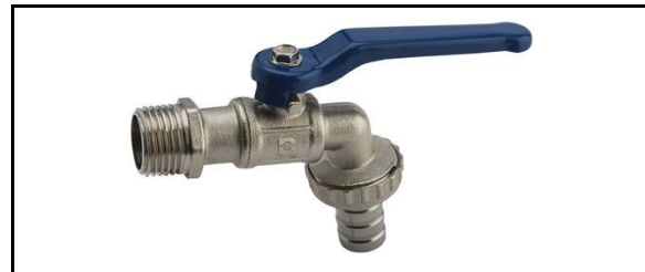
Válvula de nariz roscable para manguera (tipo Italiano)