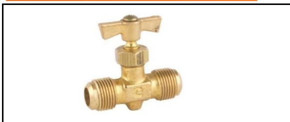
Válvula de Aguja Flare a Flare