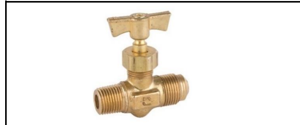
Válvula de Aguja Flare a Macho NPT