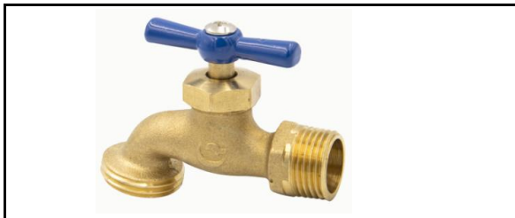
Válvula de nariz roscable