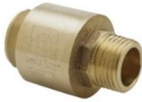
Válvulas de Retención Vertical