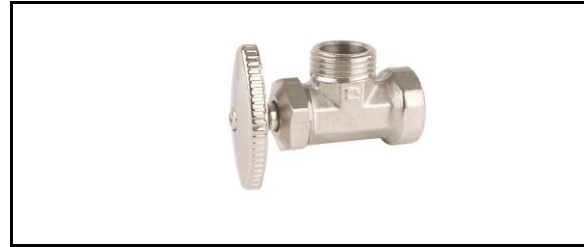
Valvula angular rosca hembra NPT por compresión