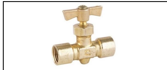
Válvula de Aguja Hembra a Hembra Ligera