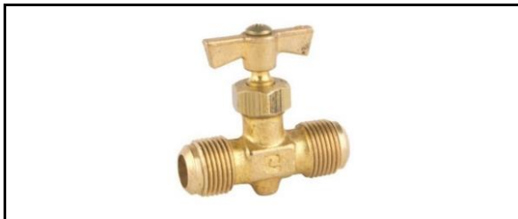
Válvula de Aguja Flare a Flare Ligera