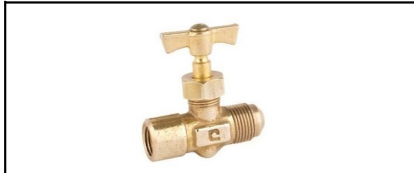
Válvula de Aguja Flare a Hembra NPT