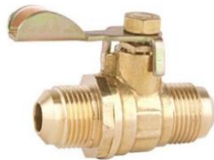
Válvula de Paso Flare a Flare