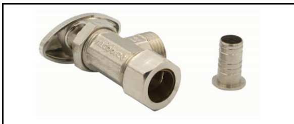
Valvula Angular de compresión con incerto para CPVC RD11