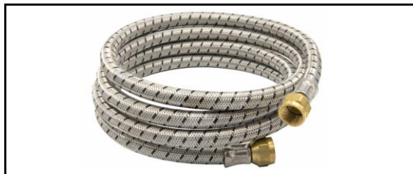
Manguera Usos Generales con tramado de aluminio