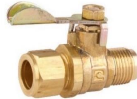
Válvula de Paso Flare a Compresión