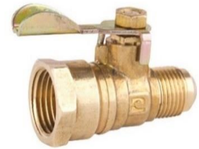
Válvula de Invierno Flare Macho a NPT Hembra