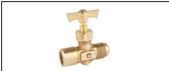
Válvula de Aguja Soldable a Flare