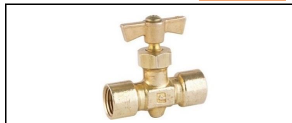
Válvula de Aguja Hembra a Hembra NPT