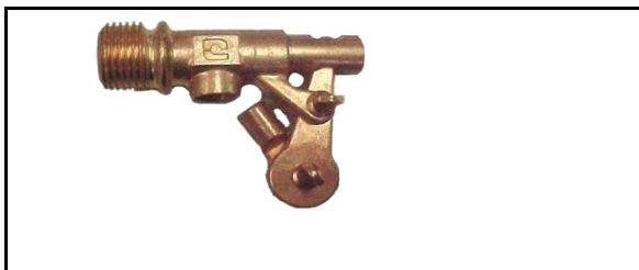
Válvulas para tinaco