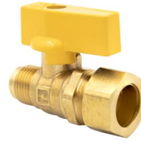
Válvula de Paso Flare a Compresión