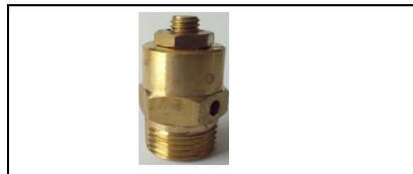
Válvula de alivio para calentador