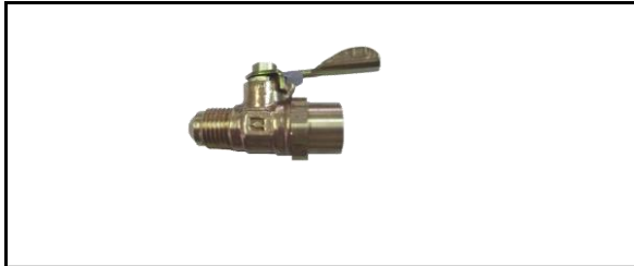
Válvula de Paso Flare Soldable