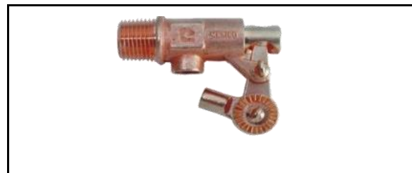
Válvulas para tinaco